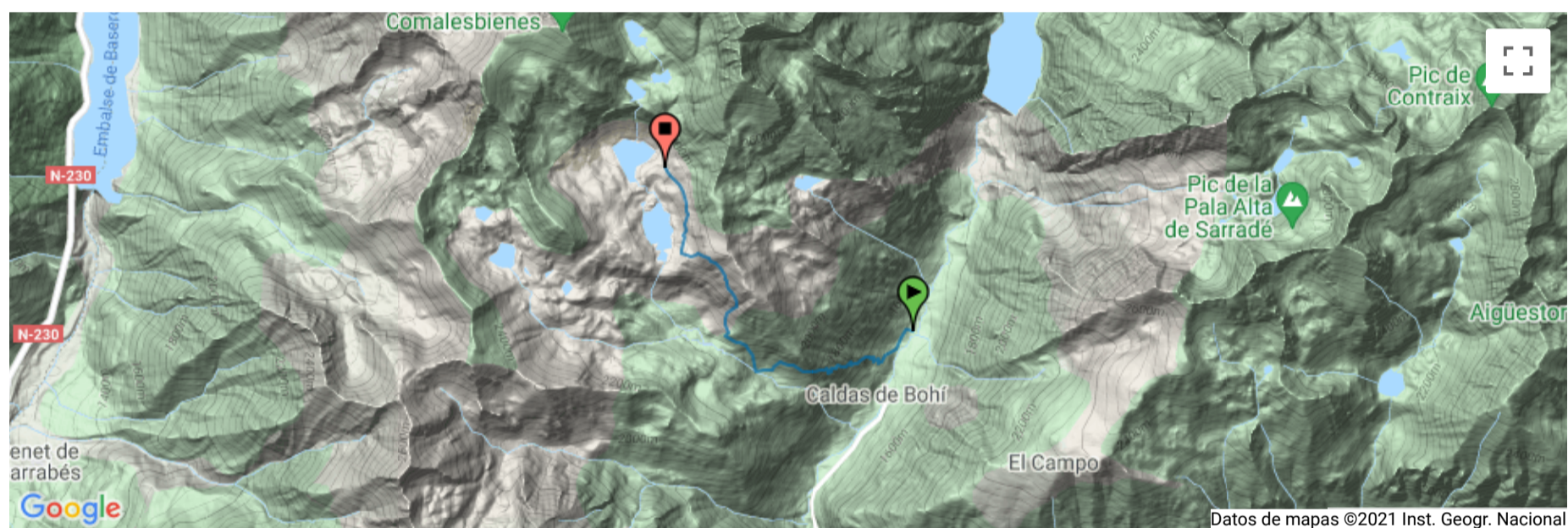
E05_toirigo_estanys G201amena on GPSies.com

Anem amb cotxe per la carretera L-500 en direcció a Caldes de Boí fins a l'aparcament que hi ha a mà esquerra passada la caseta d'informació de Toirigo (1.500 m). Del mateix pàrquing surt el camí fins als estanys Gémèna (2.257 m), a través dels plans de Llubriqueto.